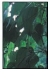
รากซาซาพาริลลา