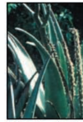
ว่านหางจระเข้