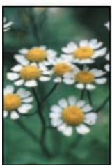
ดอกคาโมมายล์เยอรมัน