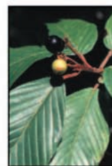
เปลือกคาสคารา