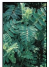
รากแอสทรากาลัส