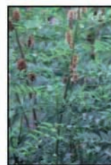
รากชะเอม