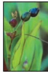
เม็ดลูกเดือย