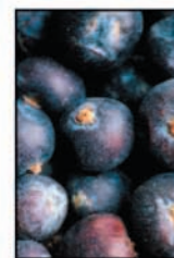
ผลจูนิเปอร์