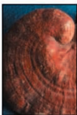
เห็ดหลินจือ