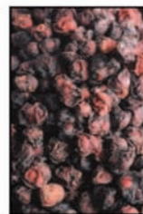
ผลชานดรา