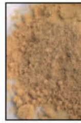
เกสรผึ้ง