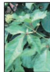
โสมไซบีเรีย