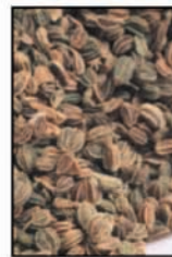
เมล็ดขึ้นฉ่าย