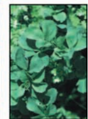
ใบอัลฟัลฟา