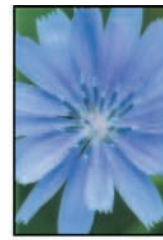
รากชี่โครี