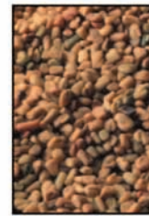
เมล็ดพริกกรีก