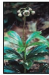
พิทพิตเซวา