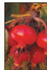
ผลโรสฮิป