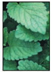
ใบเลมอน บาล์ม